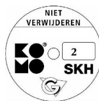
geschikt voor weerstandsklasse 2