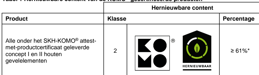
Tabel 1 Hernieuwbare content van de KOMO ® gecertificeerde producten

* gebaseerd op kozijnen en ramen vervaardigd met uitsluitend houten dorpels en stijlen, exclusief vakvulling.